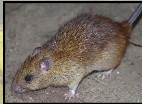
රෝග වාහක මීයා

රෝගියකුගෙන් තවත් පුද්ගලයෙකුට මෙම රෝගය බෝ වන්නේ නැත.