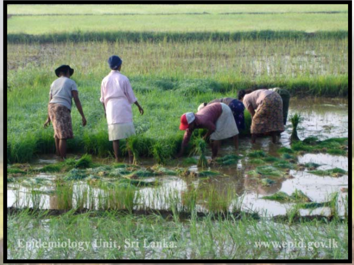
කුඹුරේ වැඩ කරන කාන්තාවන් පිරිසක්