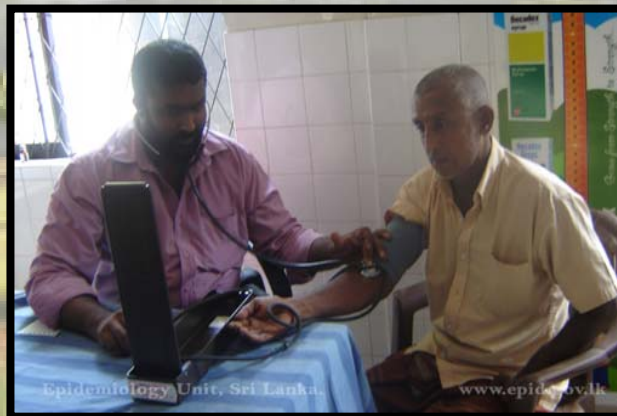
වෛද්‍යවරයෙක් රෝගියෙක් පරීක්ෂා කිරීම