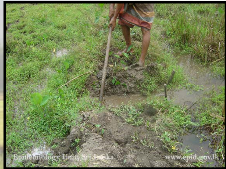
ජලය බැස යාමට සැලැස්වීමෙන් මී උණ ව්‍යාප්තිය පාලනය කළ හැක