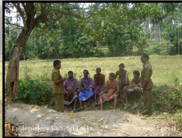
මහජන සෞඛ්‍ය පරීක්ෂක සමඟ සාකච්ඡාවක්