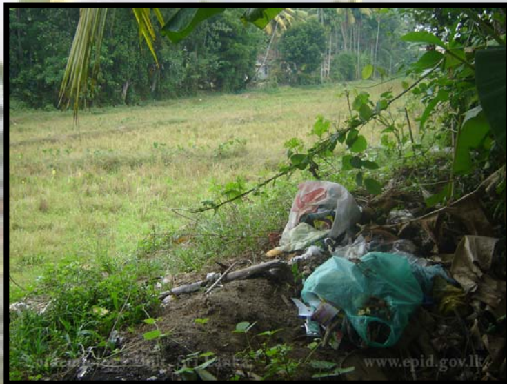
කුඹුරු අවට කැලිකසල දැමීමෙන් මියන් බෝවීම වැඩිවේ