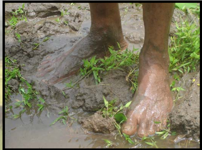
පාද වල තුවාල ඇත්නම් අවදානම වැඩිය

එම ජලයේ රැදුණු බැක්ටීරියාව සිරුරට ඇතුළු වේ.