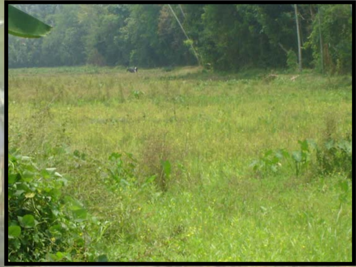
පුරන් වූ කුඹුරක්